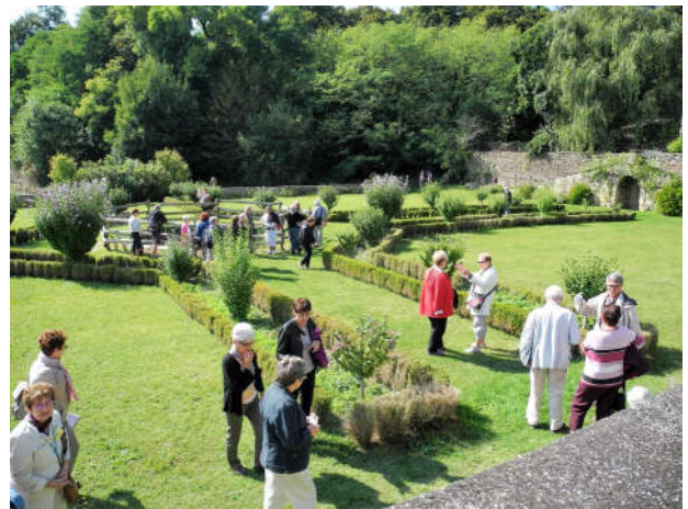
Les Rendez-vous aux Jardins ouvrent la saison, après une remise en beauté par les jardinières.