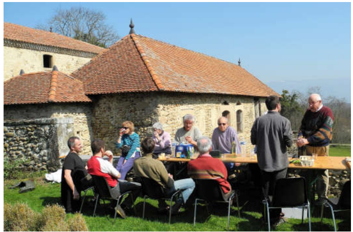
Journée "travaux de printemps", l'effort et le réconfort...