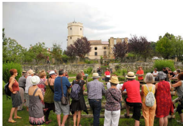
Le Bal en scène proposé par la Grange et Cie, et une pérégrination poétique emmenée par La bande à Michel en partenariat avec Textes en l'air, ainsi qu'une balade en calèche qui a transporté les